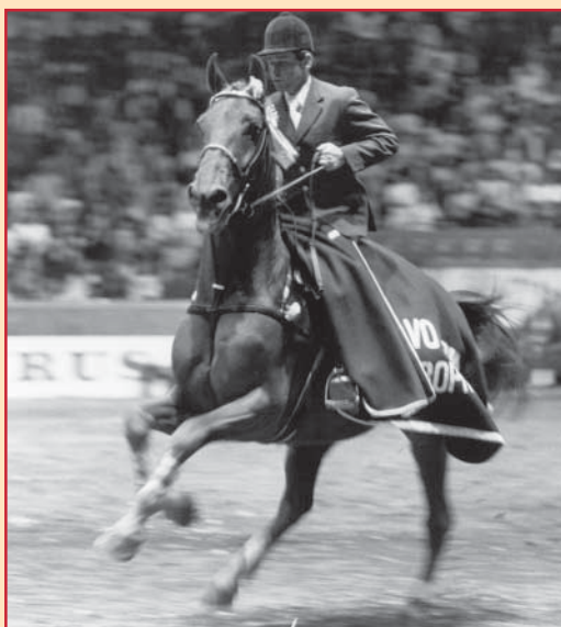
Das erfolgreichste Vereinsmitglied ist weltbekannt: Hugo Simon (hier im Jahre 1979).

Apropos Pferdmaterial: Wir finden in den historischen Aufzeichnungen keine Hinweise auf Art und Abstammung der Pferde, aber die Namen der Wettkampf-Pferde sind gelistet: Roland, Liesel, Goliath, Max, Meta, Maus, Flavius, Berta und Lotte spiegeln den Zeitgeist der frühen 30er Jahre. Jedes Ausbildungsjahr, jeder Wettkampf ist dokumentiert, die Standartenweihe am 31. Mai 1931 ein erster Höhepunkt der Vereinsgeschichte. 1937 erscheinen auf dem Deckblatt eines Wettkampfprogramms erstmalig Hakenkreuze im Hintergrund, und damit enden auch die