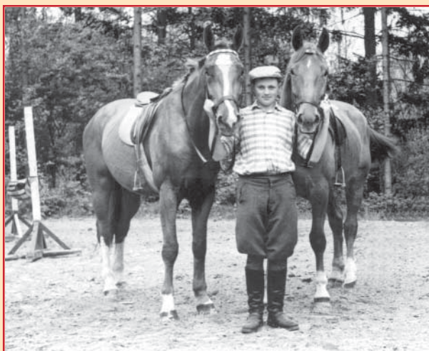
Dieses Bild aus dem Jahre 1955 zeigt die Reitmode dieser Zeit.

„Alles weitere Arbeiten musste auf den Kampf eingestellt werden, denn der Verein hat für den 22. Juni in Eistal zum Wettkampf gemeldet. Wieder galt es, Reiter