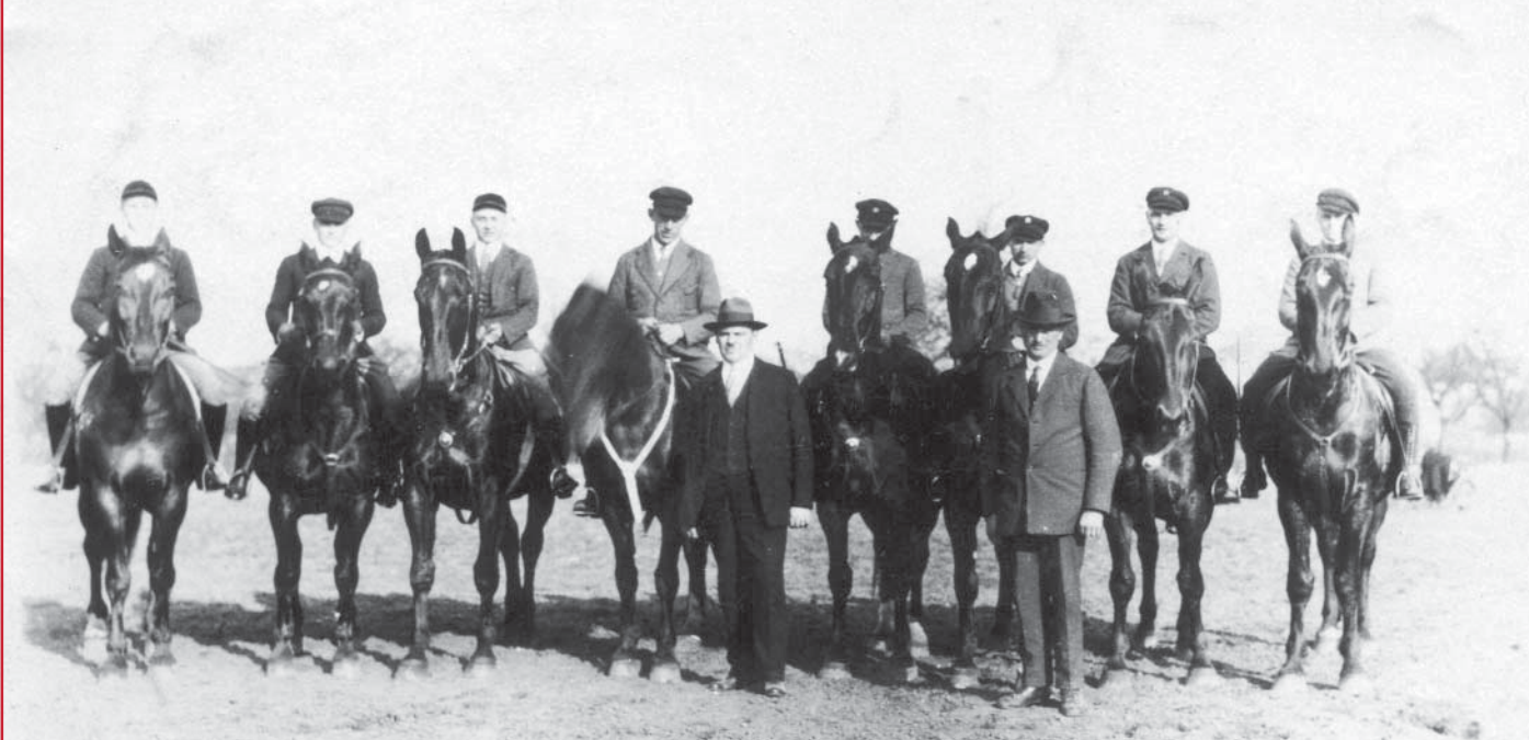
Dieses Foto aus dem Jahre 1929 ist Teil der umfangreichen Jubiläumsschönheit, die Weisenheimer Vereinsmitglieder zusammengestellt haben.

75 Jahre, ein durchschnittliches Menschenalter, ist ein überschaubarer Zeitabschnitt, könnte man meinen. 75 Jahre Pferdesportgeschichte allerdings zeigen, wieviel sich in diesem Zeitabschnitt tut und ändert. Der Reit- und Fahrverein Weisenheim am Sand hat es in einer beispielhaften Teamaktion geschafft, fast lückenlos die Geschichte des Vereins zu dokumentieren, und damit ein faszinierendes Zeugnis pferdesportlicher Zeitgeschichte vorzulegen.